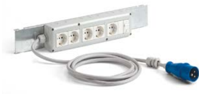
Kabellänge 3,5 m Mit verzinkter Halterung