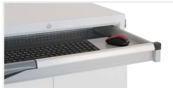
Schublade mit grau lackiertem Boden RAL7035 für Tastatur