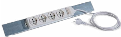
Kabellänge 2 m Mit verzinkter Halterung