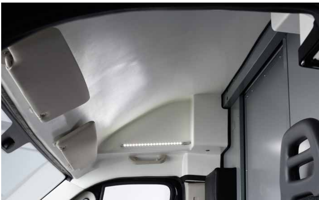
TETTO RIALZATO PER UN FACILE ACCESSO ALLA CABINA DI GUIDA