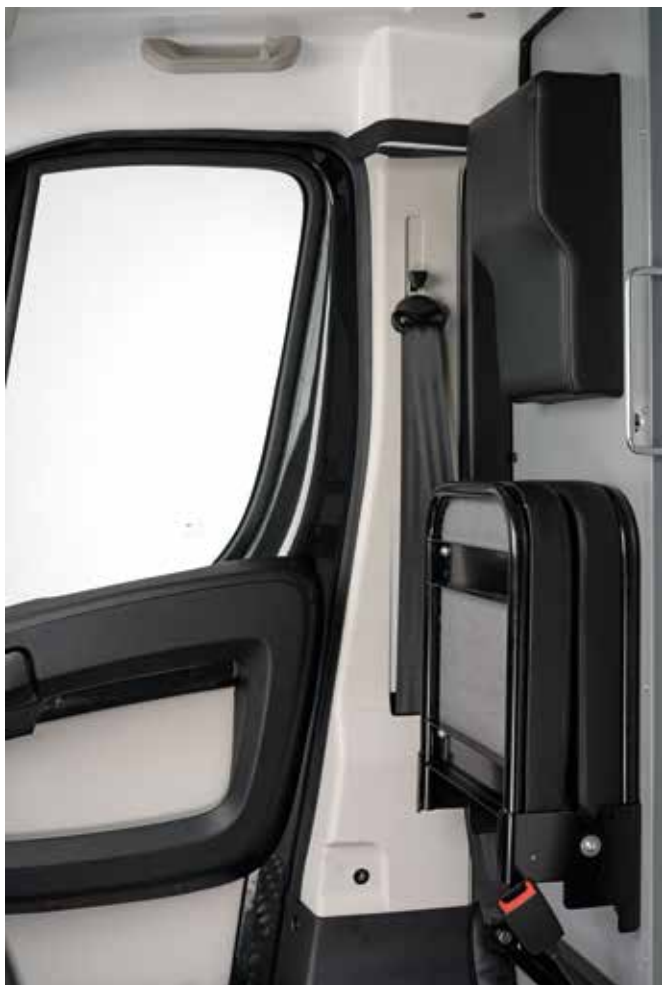
SEDILE PASSEGGERO PIEGHEVOLE